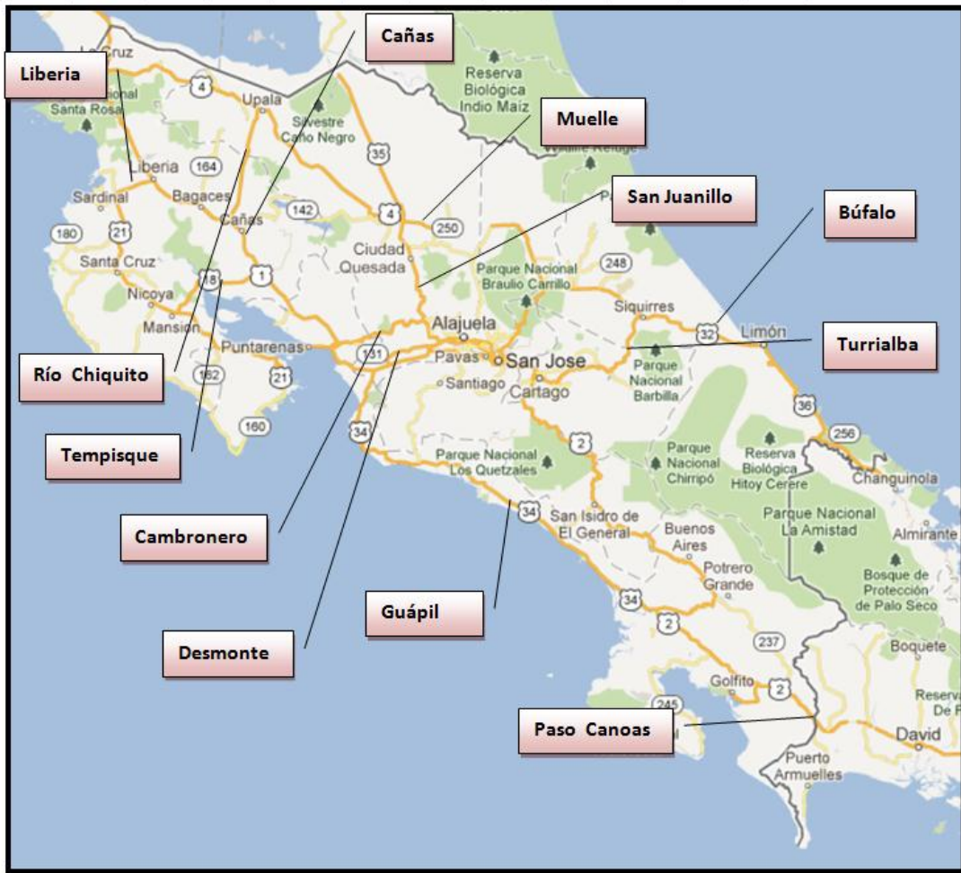
Figura 1: Ubicación geográfica de las estaciones permanentes en el país