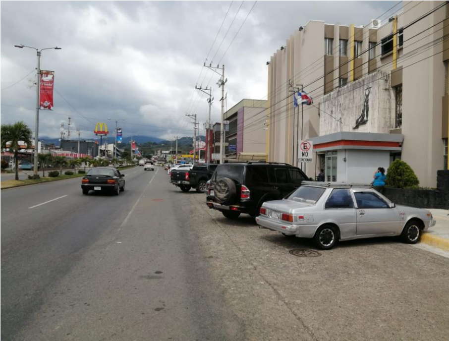
Figura 3. Sobre ancho y vía frente a los Tribunales de Justicia, sentido “sur-norte”

La zona cuenta con aceras peatonales con facilidades para personas con discapacidad como rampas de acceso y barandas, según la Ley 7600. Además, cuenta con demarcación de línea amarilla en los 38.8 m del frente de las instalaciones, así como un hidrante cerca de la rampa de acceso como se muestra a continuación: