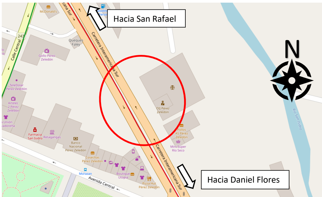
Figura 1. Ubicación geográfica de la zona de estudio en San Isidro de El General

2.1.1 Ubicación geográfica. La zona de estudio se encuentra en el distrito San Isidro de El General del cantón de Pérez Zeledón, en la provincia de San José. Al ser ruta nacional, su administración es competencia del Ministerio de Obras Públicas y Transporte (MOPT). A continuación, se muestra la ubicación de la zona de estudio (encerrado en rojo),