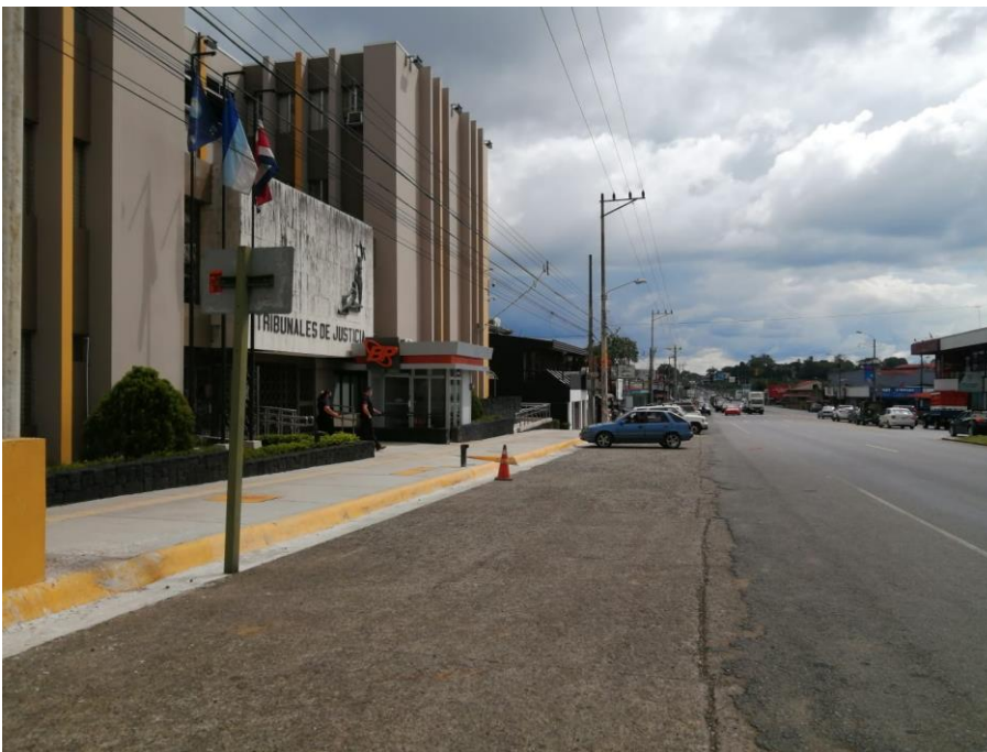
Figura 2. Sobre ancho y vía frente a los Tribunales de Justicia, sentido “norte-sur”

La zona de estudio cuenta con 4 carriles, dos por sentido de circulación, en sentido “norte-sur” y viceversa, un ancho de carril de 3.5 m de ancho aproximadamente, con pendientes de 2%, una velocidad máxima reglamentaria de 40 km/h, cuenta con un sobre ancho de 6.6 m y un tránsito promedio diario anual de 14 325 vehículos (Secretaría de Planificación Sectorial, 2021). A continuación, se muestran imágenes de la zona de estudio: