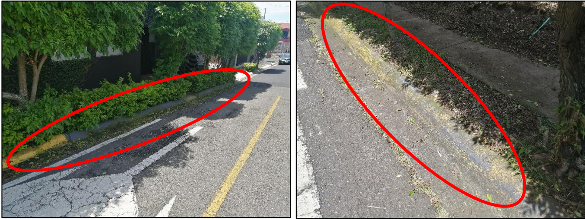
Figuras 3 y 4. Secciones con pintura gris frente al comercio AQUAFIT y cordón amarillo muy desgastado, vía cantonal 409086-00, Urb. Lomas de San Pablo, Heredia.