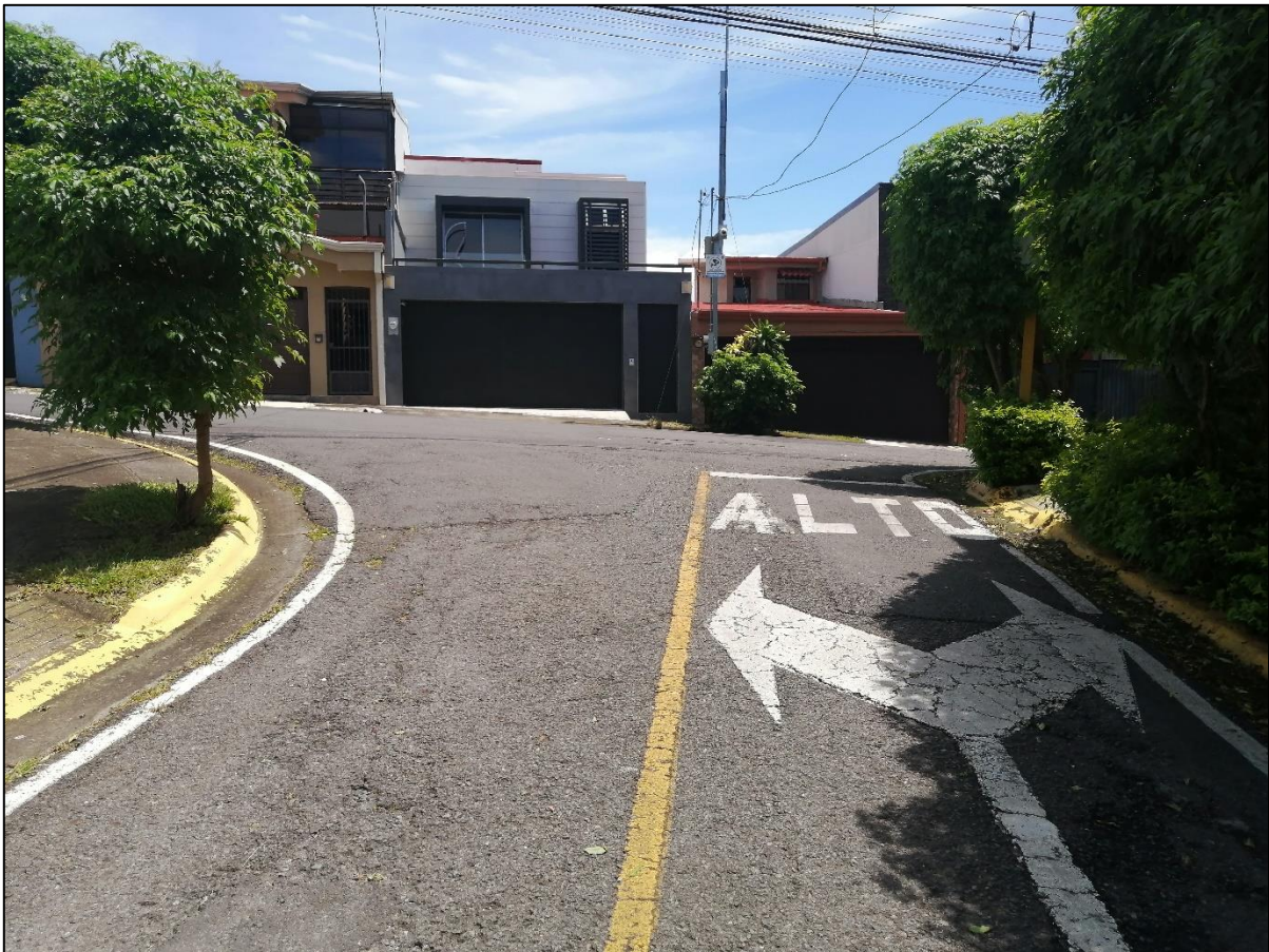
Figura 2. Sección con demarcación existente y agrietamiento, Urb. Lomas de San Pablo, Heredia.

En las siguientes figuras se ilustra lo observado en la zona de estudio: