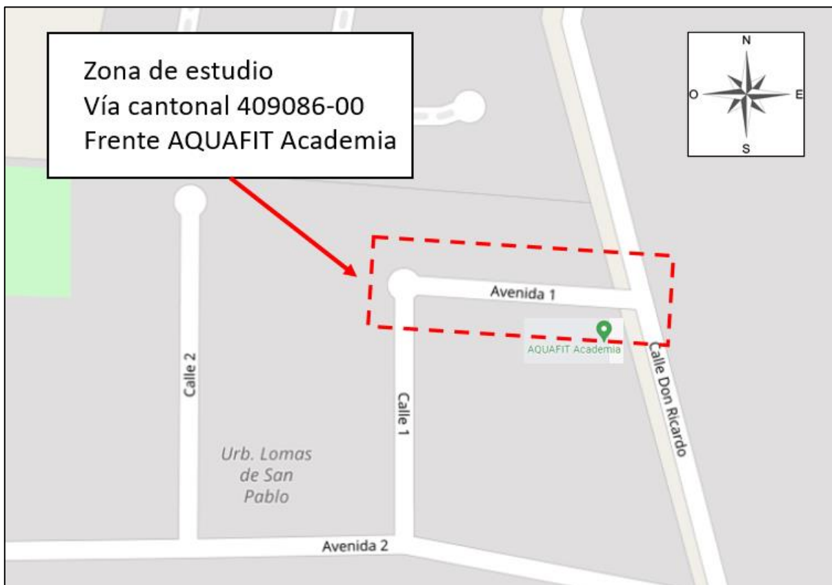
Figura 1. Vía cantonal 409086-00, Urbanización Lomas de San Pablo, Heredia.

La zona de estudio se emplaza en la provincia de Heredia, Cantón: San Pablo, Distrito: Rincón de Sabanilla, mientras que las coordenadas geográficas aproximadas según el sistema de ubicación geográfica “Costa Rica Transversal Mercator O5” (CRTM O5) son: 488579.4378 Este, 1104311.1473 Norte.