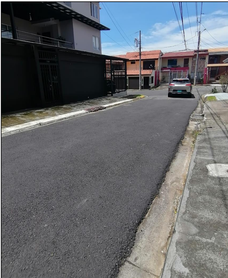
Figura 5. Sección recarpeteada, vía cantonal 409086-00, Urb. Lomas de San Pablo, Heredia.