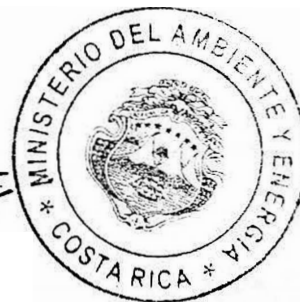
Ministro de Ambiente y Energía

1 vez.—O. C. N° 31881.—Solicitud N° 18603.—( D40729-IN2017187106 ).