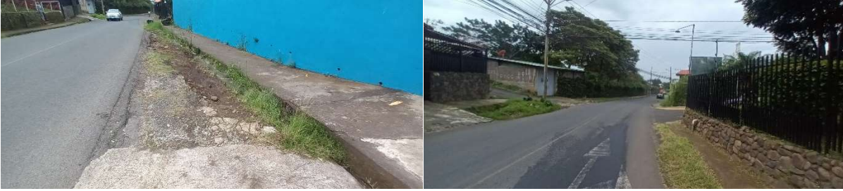
Figuras N° 2-11: Situación actual en la zona de estudio.