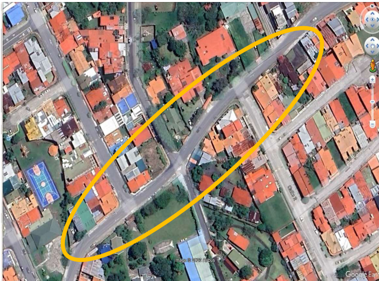
Figura N° 1 Centro Educativo Shkénuk de Barva de Heredia.

La zona de estudio se emplaza en la provincia de Heredia, Cantón: Barva, Distrito: Santa Lucía, mientras que las coordenadas geográficas según el sistema de ubicación geográfica "Costa Rica Transversal Mercator 05" (CRTM 05) son: 487 255,69 Este, 1 107 466,58 Norte