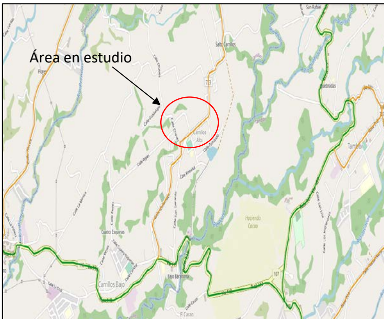
Figura 1 Zona de estudio, Carrillos Alto de Poás

El área en estudio es en Carrillos Alto de Poás, se muestra una imagen del área en estudio: