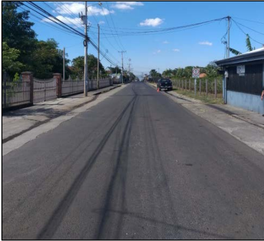
Figura N° 2 Carrillos Alto, sentido noreste – suroeste