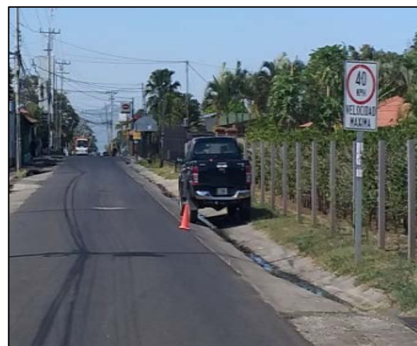
Figura N° 6 Señalamiento vertical existente