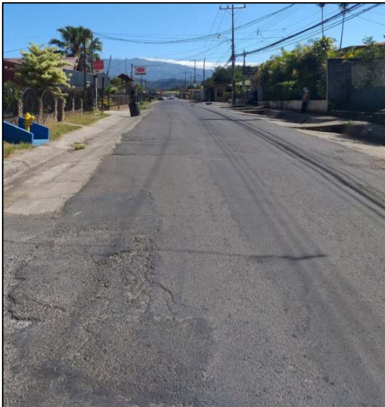
Figura N° 3 Carrillos Alto, sentido suroeste – noreste