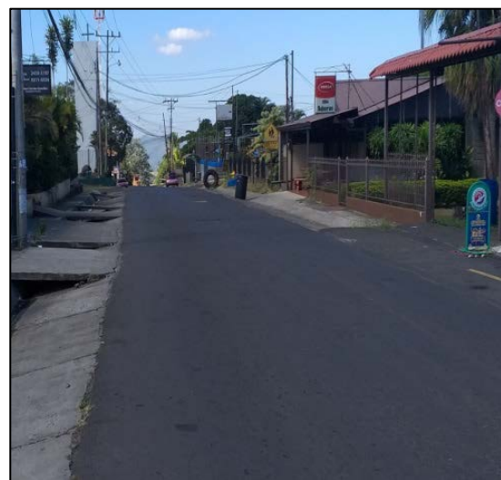
Figura N° 5 Parada de autobús y comercio