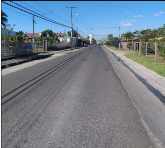
Figura N° 4 Cuneta y aceras