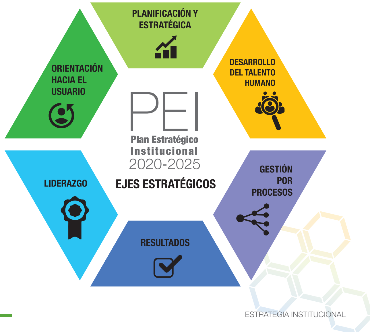
Figura 2 Ejes estratégicos del PEI

maestras de intervención estratégicas (ejes) a atender en los próximos cinco años (figura 2).