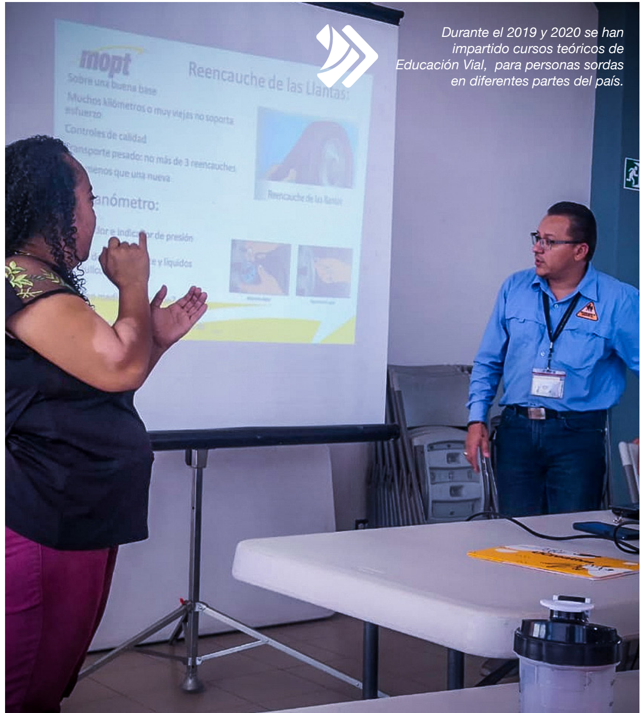
Durante el 2019 y 2020 se han impartido cursos teóricos de Educación Vial, para personas sordas en diferentes partes del país.

El Ministerio es el responsable de todo el sistema nacional de acreditación de conductores, incluyendo el proceso de formación y expedición de licencias de conducir.