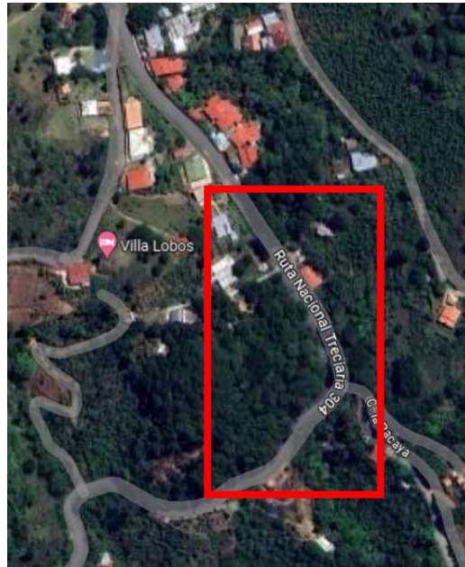
Figura 1: Zona de estudio