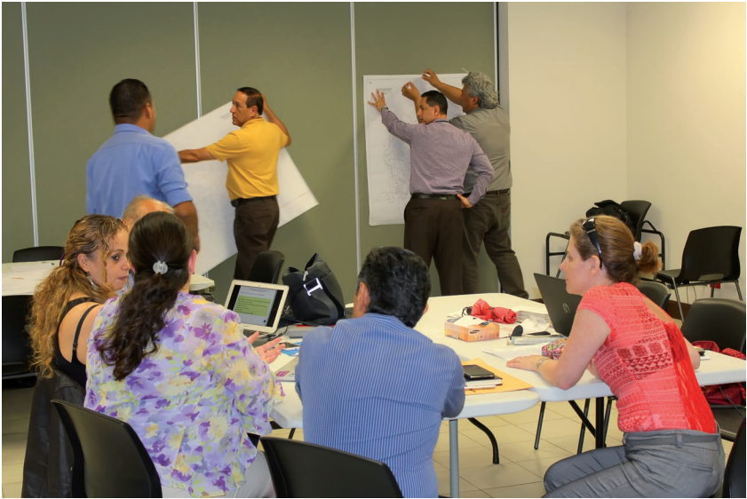
Taller sobre Microempresas con los consultores internacionales, personeros del MOPT y Unidades Técnicas Municipales

En el tema de la formalización y dependiendo de la forma jurídica que se seleccione, se debe realizar el proceso de capacitación y asesoría.