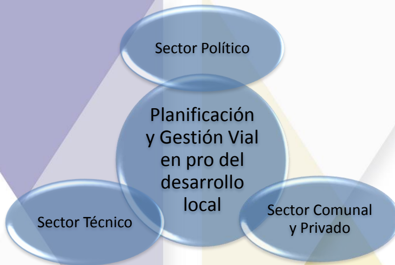
Figura 1. Interrelación de diferentes actores en la planificación y gestión vial.

El Plan de Conservación, Desarrollo y Seguridad Vial Cantonal (PCDSVC) debe responder no sólo a las necesidades de un sector, sino a las de los tres sectores mencionados anteriormente. Por otro lado, el contenido de los talleres permitirá valorar y trabajar en la alineación de las estrategias de los diferentes planes municipales (como el plan de desarrollo humano cantonal, el plan estratégico municipal y el plan regulador, entre otros), ello con el objetivo de lograr el desarrollo local integral.