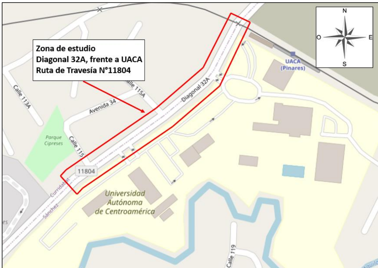
Figura 1. Zona de estudio, sección Diagonal 32A, Ruta de Travesía N°11804, Curridabat.

La zona de estudio se ubica en la provincia de San José, Cantón: Curridabat, Distrito: Curridabat, mientras que las coordenadas geográficas según el sistema de ubicación geográfica "Costa Rica Transversal Mercator O5" (CRTM O5) son: 497239.4527 Este, 1096754.9702 Norte.