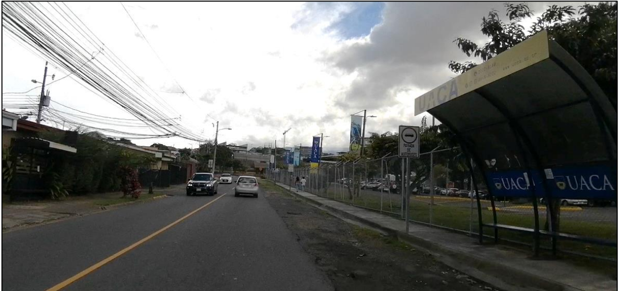
Figura 3. Paradas de Autobus frente a UACA, Ruta de Travesía N°11804, Curridabat.