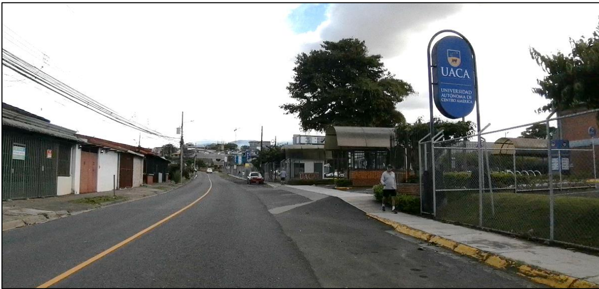
Figura 2. Acceso 1 UACA y sobrancho, Ruta de Travesía N°11804, Curridabat.

En las siguientes figuras se ilustra lo observado en la zona de estudio: