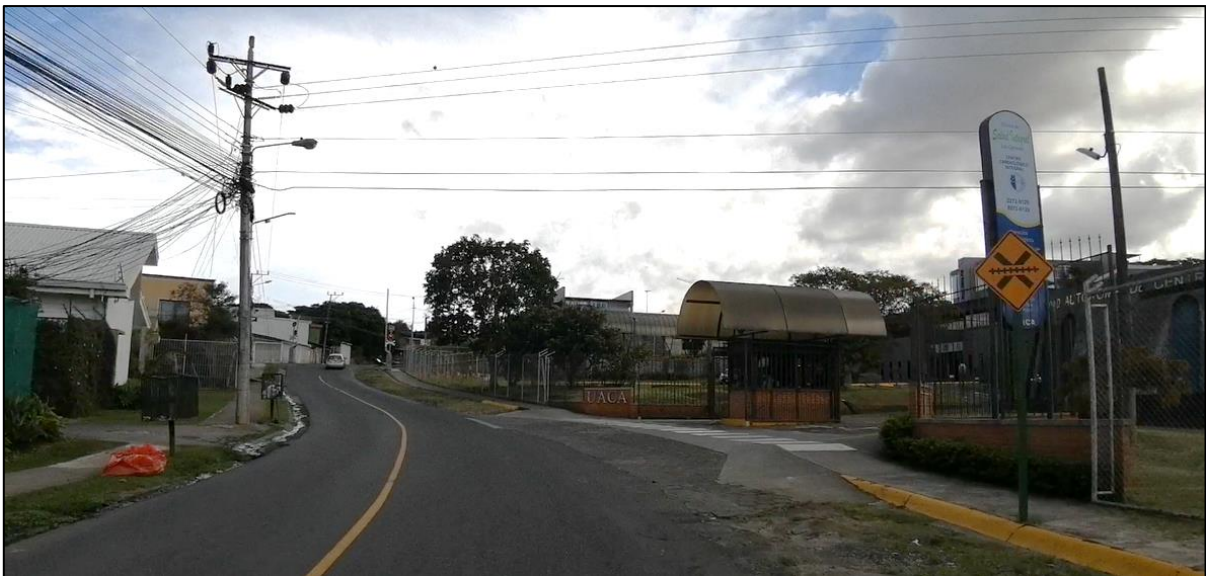
Figura 4. Acceso 2 UACA y sobrecancho, Ruta de Travesía N°11804, Curridabat.