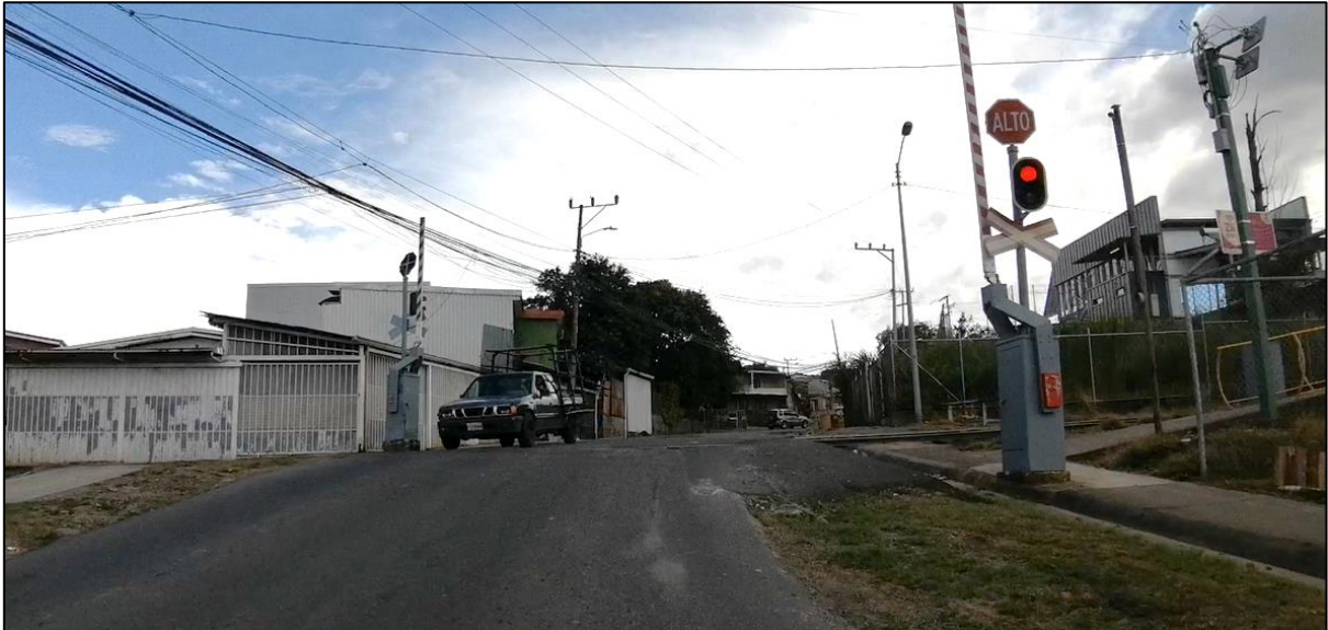
Figura 5. Cruce ferroviario, Ruta de Travesía N°11804, Curridabat.

A continuación, se presentan los resultados de los aforos realizados con el radar de velocidades el 13 de diciembre de 2023 frente a la UACA, con el objetivo de cuantificar el rango de las velocidades registradas en el sentido de los carriles existentes de la vía, tomando en consideración la velocidad de 40 km/h y los lineamientos técnicos según el Decreto N°40601 Reglamento para la Instalación y Eliminación de Reductores de Velocidad en las Vías.