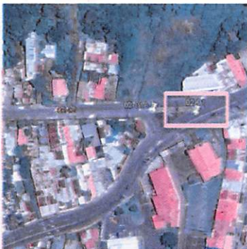
Figura 1: Zona de estudio

La zona de estudio consiste en el Cierre Parcial sobre Ruta Nacional 102, en Moravia, para la Evaluación del Plan de Manejo de Tránsito: Colector Rivera 2, Pozo 02-01 Moravia, Ruta Nacional 102.