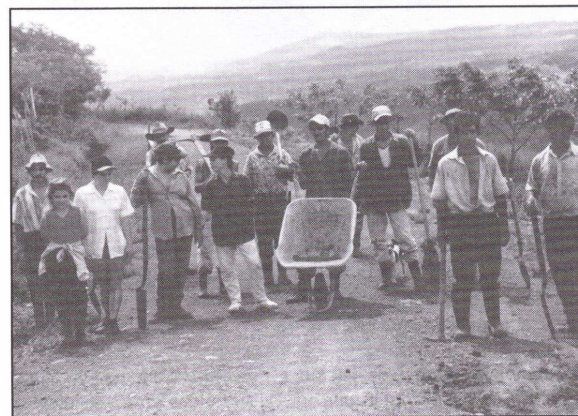
Figura 1: Vecinos después de realizar obras de mantenimiento manual en la comunidad de Aguas Buenas, Pérez Zeledón.

Sociedad se define como el grupo de seres humanos que cooperan en la realización de varios de sus intereses principales, entre los que figuran su propio mantenimiento y preservación. El concepto de sociedad comprende relaciones sociales en los diferentes grupos humanos, los cuales están representados por hombres y mujeres.