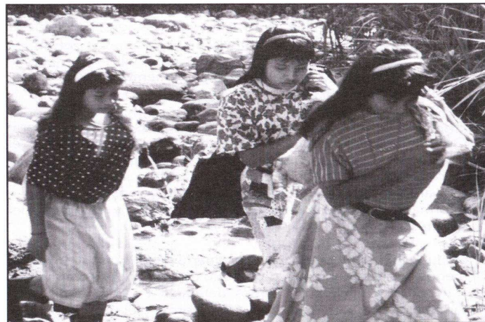
Figura 6: Mujeres organizadas, Comunidad Awari, Reserva Chirripó, Turrialba.

Los comités de caminos se componen de una Asamblea General, en la que pueden participar todos los vecinos de la comunidad y una Junta Directiva integrada preferiblemente por hombres y mujeres.