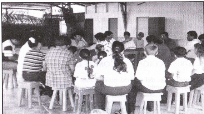
Figura 10: Reunión de Vecinos, Cantón Pérez Zeledón.

Usualmente las personas que habitan en una comunidad, conocen a las demás personas, en lo que respecta a la disposición y responsabilidad, también a su proyección como líder comunal.