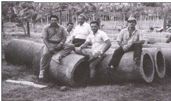
Figura 9: ¡Ya fabricamos los tubos!. Comunidad en el Cantón Guatuso, Alajuela.

Los vocales sustituirán temporalmente, por su orden, a los miembros de la Junta Directiva, excepto el presidente que será sustituido por el vicepresidente.