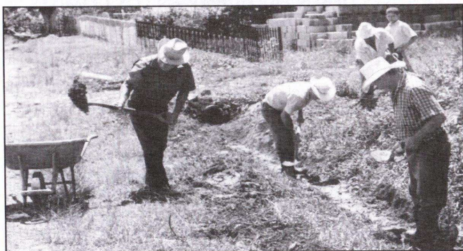
Figura 8: Comité de caminos de La Linda, Pérez Zeledón.