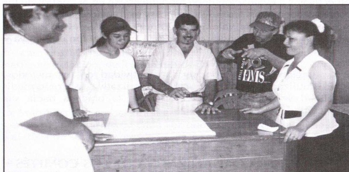
Figura 5: Comité de caminos de la comunidad de la Sierra, Pérez Zeledón.