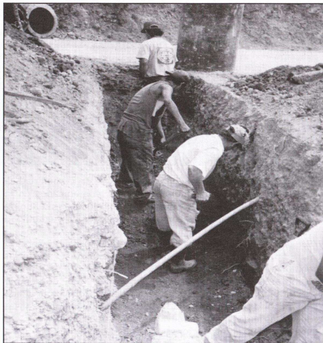
Figura 2: Miembros del Comité de Caminos, Acosta, San José.

En Asamblea General de vecinos, los comités integran la Junta Directiva, integrada por 8 personas distribuidas en los siguientes puestos: Presidente(a), Vicepresidente(a), Secretario(a), Tesorero(a), Vocal I, Vocal II, Vocal III, todos con voz y voto, también un fiscal que tiene voz pero no voto.