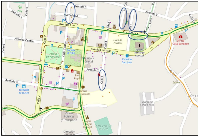
Figura 1. Ubicación de las zonas de estudio