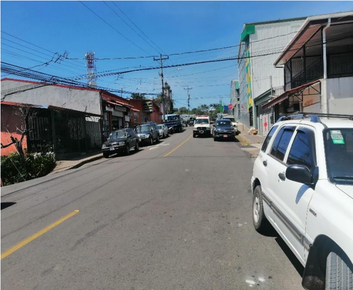
Figura 5. Condición actual de la Zona 3.