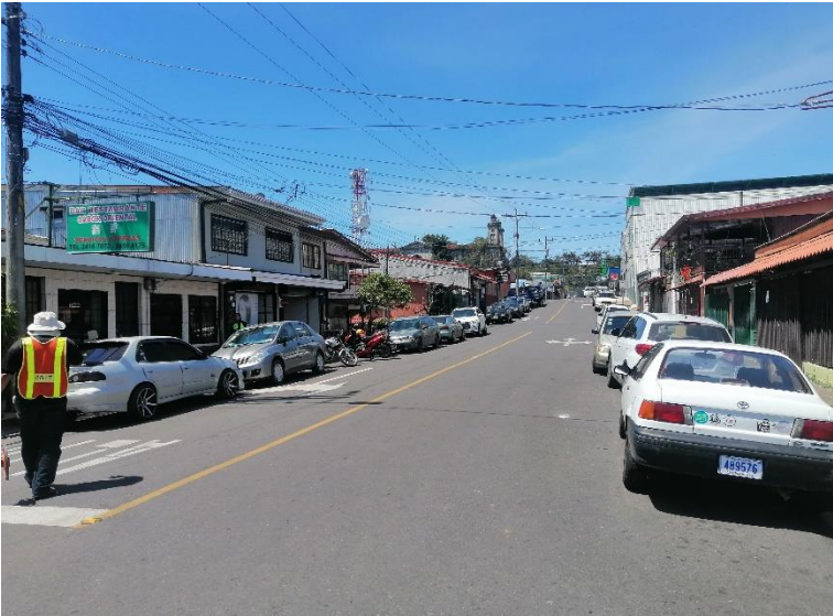
Figura 5. Condición actual de la Zona 3