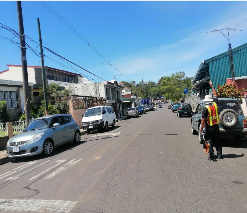
Figura 7. Condición actual Zona 4, Calle 03.