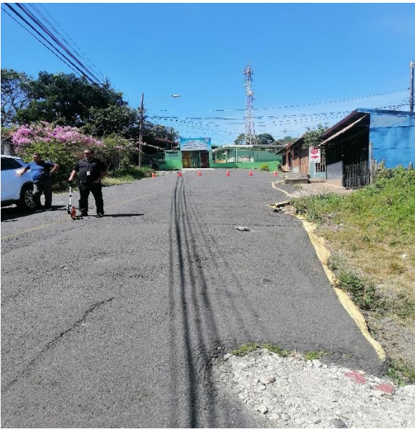
Figura 3. Condición actual de la Zona 2.

Se cuenta con aceras discontinuas que no reúnen las condiciones de la Ley 7600 en ambos márgenes de la Calle 03. El señalamiento horizontal y vertical es borroso y existen tramos de la vía con la carpeta asfáltica en mal estado.