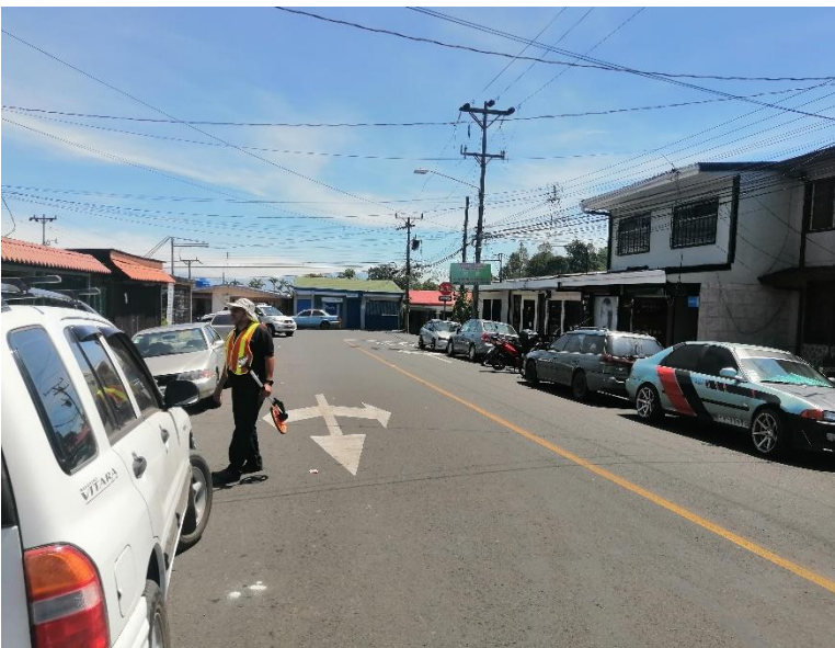
Figura 4. Condición actual de la Zona 3.