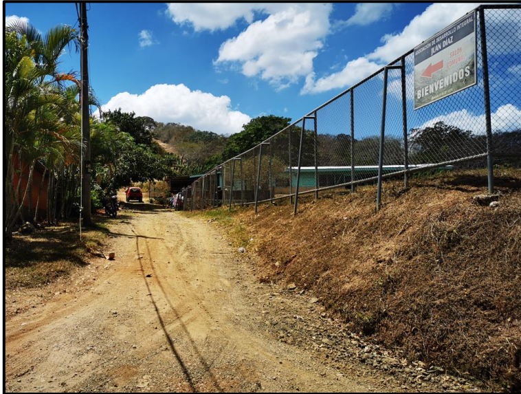
Imagen N° 3. Escuela y plaza de futbol La Juan Díaz.