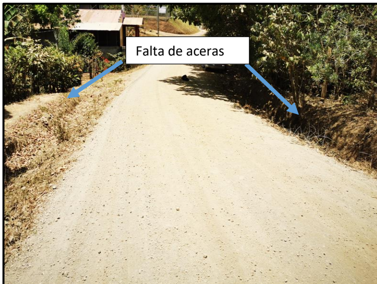
Imagen N° 4. Falta de acera.