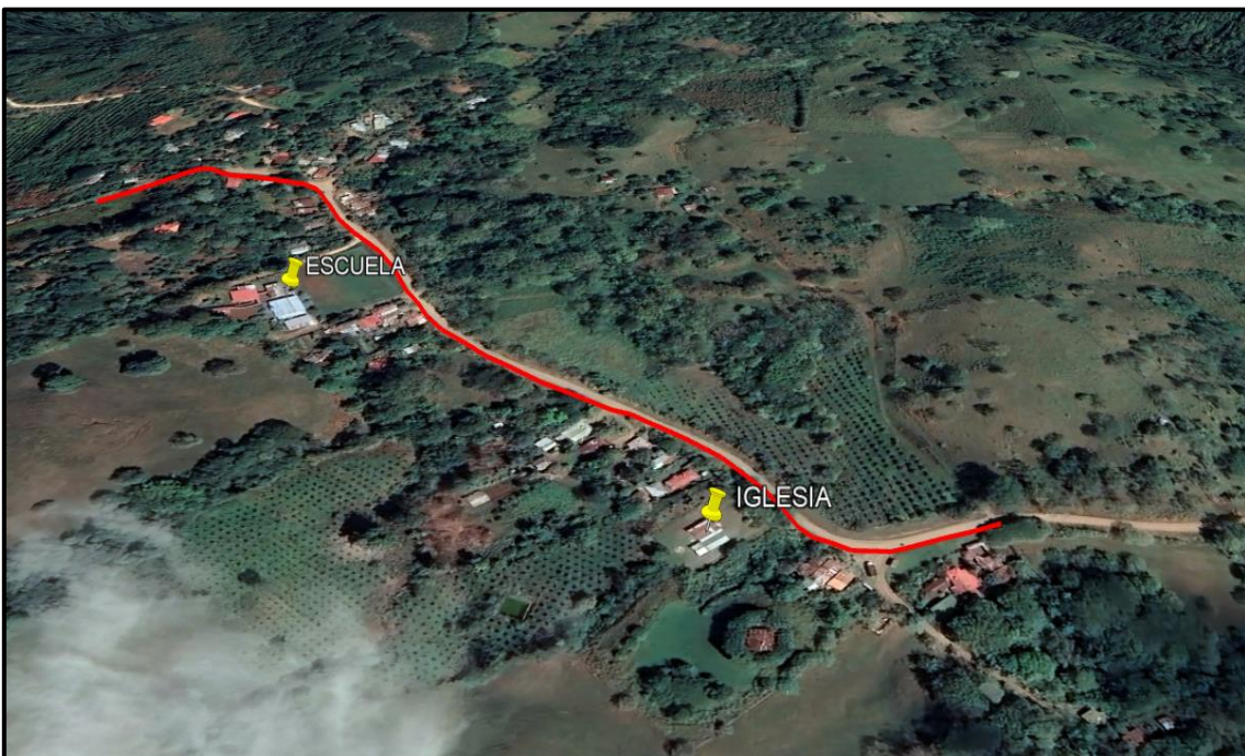
Imagen N°7. Ubicación de aceras propuestas en los alrededores de la zona de estudio.