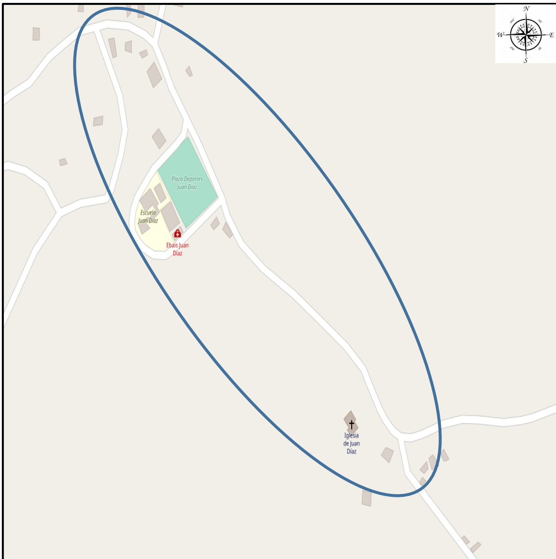
Imagen N° 1. Zona de estudio La Juan Díaz Nicoya, coordenadas (N01127374, E00331192).

El estudio técnico para el señalamiento vertical de zona escolar, en los alrededores de la Escuela Blas Montes Leal, sobre Ruta Cantonal, ubicada en el cantón de Nicoya en la Provincia de Guanacaste.