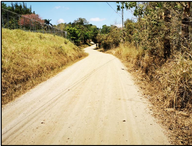
Imagen N° 2. Vía en lastre.