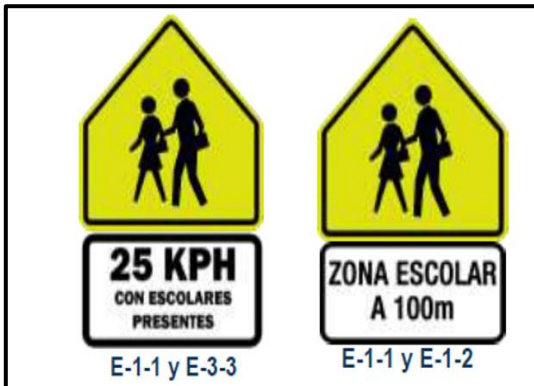
Imagen N° 5. Plantillas de zonas escolares

ser colocada a no menos de 45 m del centro educativo; además se debe de colocar la señal E-1-1 con la complementaria E-2 “Zona escolar a 100 m” y ubicare 100 m antes de la zona escolar (Secretaria de Integración Económica Centroamericana, 2014).