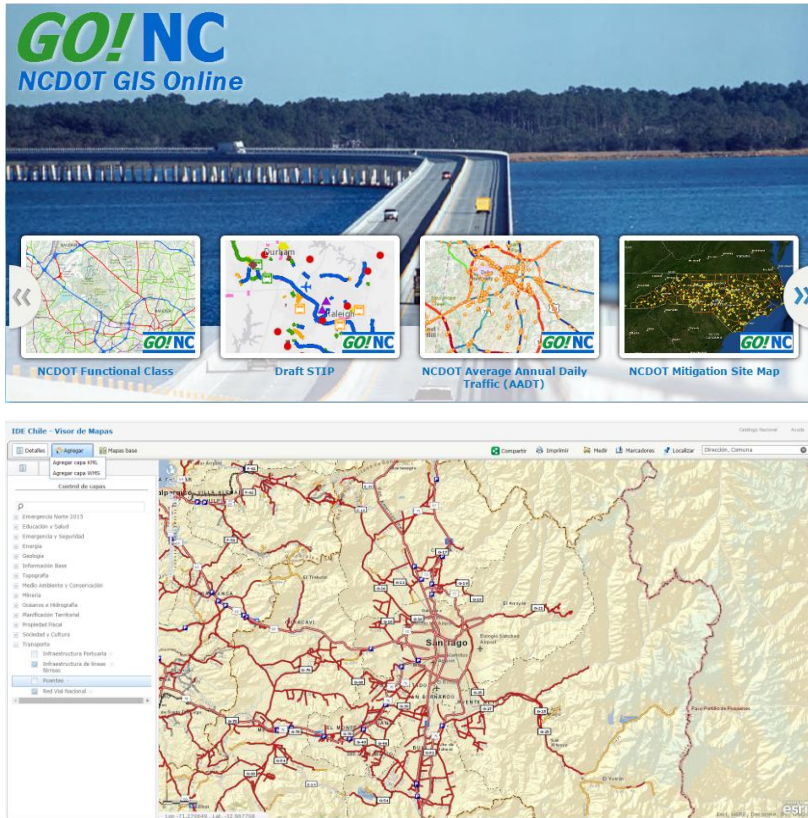
Figura 1. Ejemplos de portales con visores cartográficos

Valencia. Otro ejemplo es el Geoportal de Chile, el cual permite al usuario ver la información que necesite desplegar e inclusive, agregar capas con información propia. Se pueden ver ejemplos de estos en la figura 1.